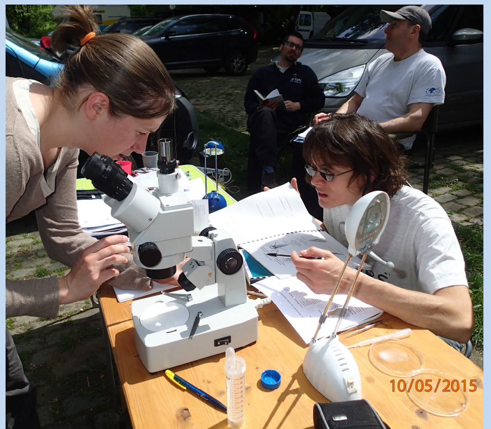
Détermination de l'indice biotique des plans d'eau expertisés