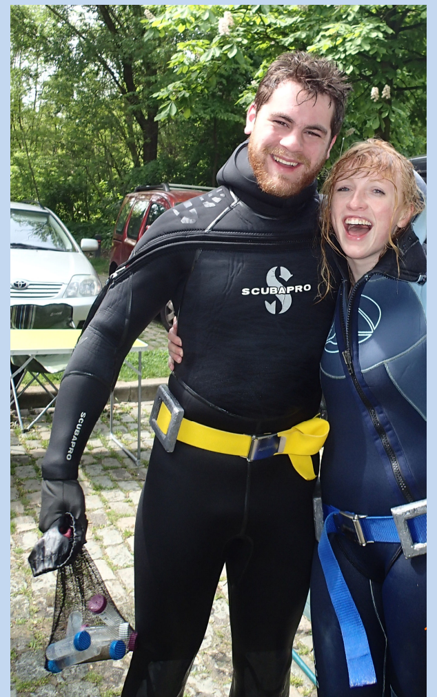
Plongées de récolte